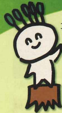
イメージキャラクター マモルくん