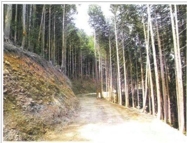
基幹作業道(幅員3.6m)・間伐前