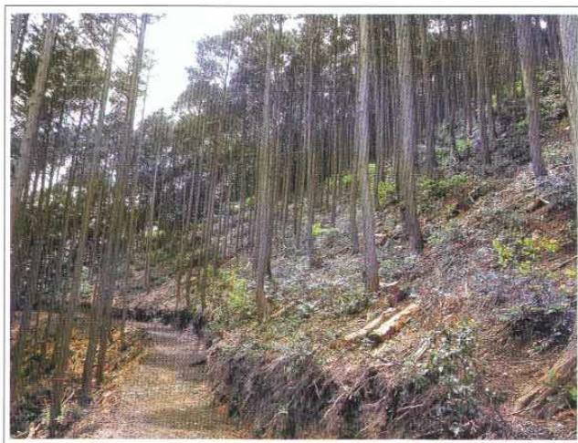
木材搬出用作業道(幅員2.5m)・利用間伐実施後