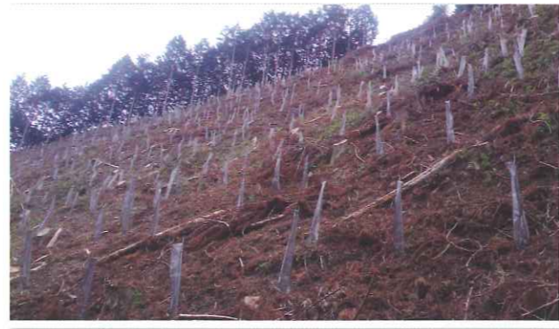
植栽後、獣害防止資材を設置しました