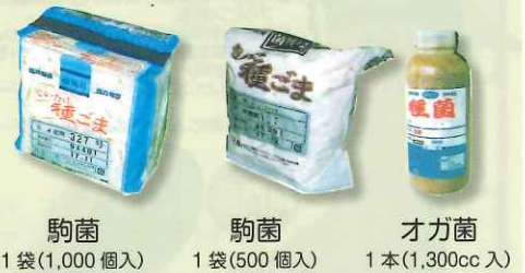
駒菌 1袋(1,000個入) 駒菌 1袋(500個入) オガ菌 1本(1,300cc入)