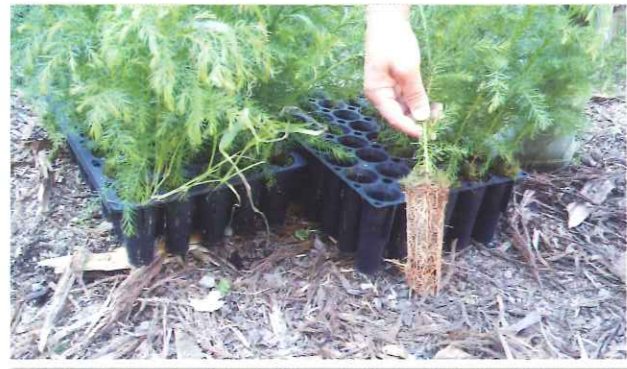
植栽したコンテナ苗

今後の課題や、ノウハウを把握することができ、より低コストに向けた改善策を検討することができたと考えます。