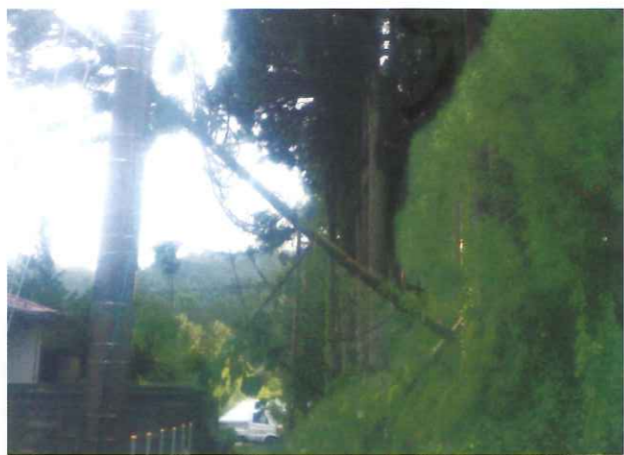
台風21号被害の様子

近年、全国的に多発する台風被害は、ここ揖斐郡内の山林においても倒木や折損など甚大な被害をもたらしています。こうした被害は奥山だけにとどまらず、住宅や道路に近い里山、神社・寺院の境内に植栽されている樹木にまで及び、建物の屋根を壊し電線などのライフラインを切断しました。倒木は作業の行く手をも阻み、復旧までにかなりの時間を要す結果となっています。