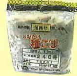
駒菌 1袋(800個入) およそ原木24本分