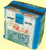
駒菌 1袋(1,000個入) およそ原木30本分