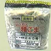
駒菌 1袋(800個入) およそ原木24本分