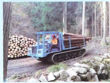
フォワーダによる運材