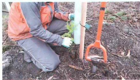
専用器具によるコンテナ苗の植栽