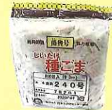
駒菌 1袋(800個入) およそ原木24本分