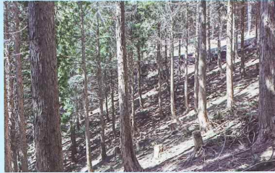
間伐実施後の山林