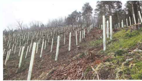
植栽後の獣害防止資材の設置