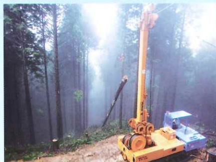
タワーヤードによる集材