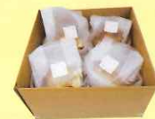
マイタケほだ木 1箱(4個入り)