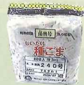
駒菌 1袋(800個入) およそ原木24本分