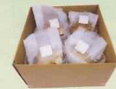
まいたけほだ木 1箱(4個入り)