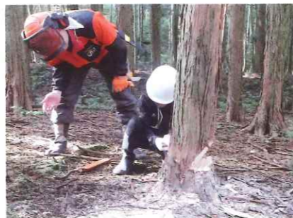
追い口切りをする男の子

伐倒後に、切り株の年輪を数えたり、のこざりて枝を切ったりと自分たちで倒した木に興味津々でした。 小学生の子たちが山に興味を持っていただく良い機会になったかと思えます。