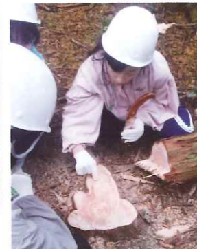
切り株の年輪を数える女の子