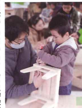
親子でアイス作り

一日目は、荒天のため午後から中止となりましたが、コロナウイルス感染症の規制が緩和されたことの影響もあり多くの方が来場されました。今年小さい子だけではなく、ご年配の方等幅広い世代の方に利用して頂きました。普段使い慣れない金槌での作業に、大人も子供も苦戦されていましたが、皆さん楽しそうでした。出来上がった作品をスタッフに嬉しそうに見せてくれる子もいました。 今年も多くの方が楽しんで頂ける企画を実施出来ればと思えます。