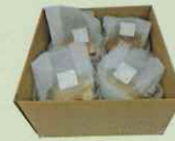
まいたけほだ木 1箱(4個入り)