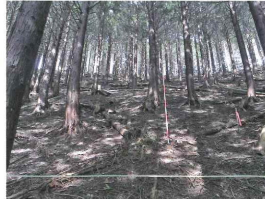
間伐実施前の森林

・集約化した施業地内において、出来るだけ地形に沿った路網を整備し、高性能林業機械の活用により低コスト化を進め、組合員の皆様への利益還元に取り組んでいます。