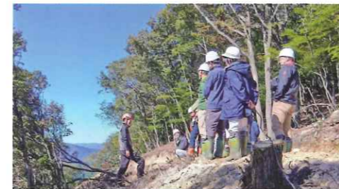
広葉樹林施業地での研修

・昨年の11月7日～8日、飛騨市森林組合様を講師としてお招きし、SDGsに貢献する循環型林業の確立に向けた、素材生産量の更なる拡大及び施業集約化の加速化を目的とする研修会を実施しました。実際に皆伐を行っている現場、当組合として初めて実施する広葉樹林施業地等において指導を受けました。効率的な施業方法や森林の更新についてなど活発な意見交換が行われました。