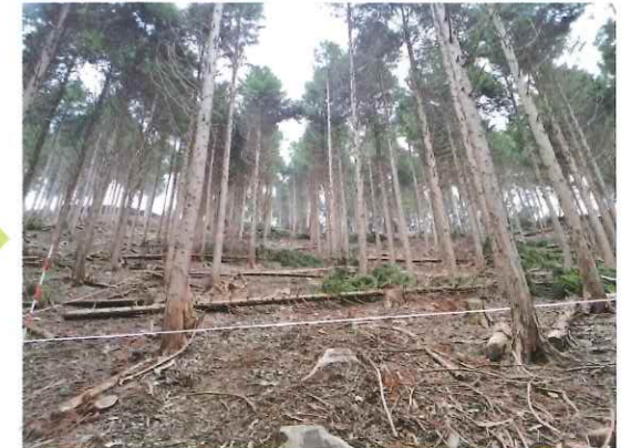
間伐実施後の森林