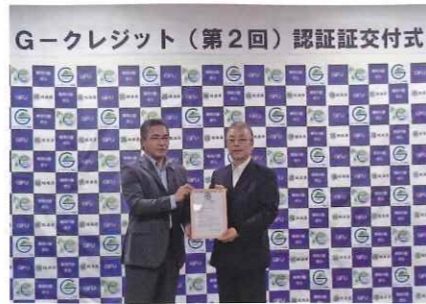
G-クレジット (第2回) 認証証交付式