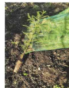
少花粉コンテナ苗

・成熟した人工林を計画的に伐採し、木材を有効活用することで、森林資源を無駄なく循環させ、森林を健全に保ちます。適切な主伐は森林資源の持続的サイクルの第一歩です。「伐って、使って、植える」主伐と再造林(少花粉スギコンテナ苗の植栽)を推進し、次世代へ持続可能な森林を引き継ぎます。