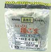
駒菌 1袋(800個入) およそ原木24本分