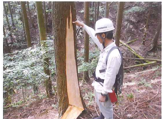
スギの皮むき被害

また、搬出間伐後の保残木には、被害防止として、幹にテープ巻やロープ巻の施業提案をしています。皮むき被害も多くありますが、ヤマヒルやマダニも、生息区域が拡大されているように思います。