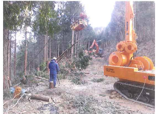
タワーヤードによる搬出間伐

森林経営計画団地内を何度も踏査・調査し、これまでは、徒歩でしか入れなかった林内へ作業路等を開設し、地形や傾斜、またスギ・ヒノキ等の分布を考慮しながら、集材ポイントを決め、高性能林業機械を使って搬出間伐を行っています。